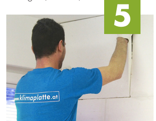
5 Klimaplatzen im Verbund verlegen