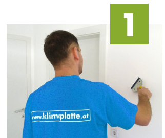
1 Untergrund vorbereiten

8911 Admont, +43 3613 3226 8940 Liezen, +43 03612 26110 8786 Rottenmann, +43 03614 3650 8942 Wörschach, +43 03682 22767