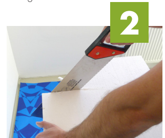
2 Platten zuschneiden