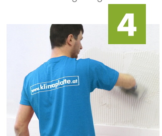
4 Kleber auf mit Zahnspatel auf Wand auftragen (8-10mm)