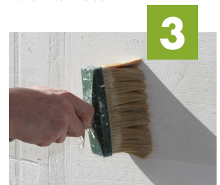
3 Platten und Untergrund grundieren